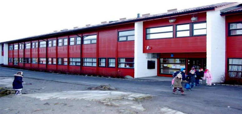
Bjørndal skole 01.12.2010